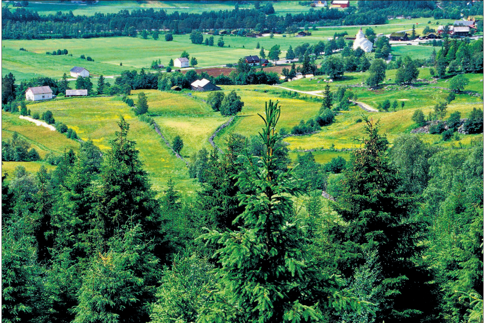
De fleste jordbruksområder har de siste 100 årene endret seg gradvis. En utstrakt og ekstensiv arealbruk er avløst av konsentrert innsats på få og mer produktive eng- og åkerarealer. Bildene fra Valle viser dette. På bildet fra 1992 (t.v.) er gammel eng- og åkermark med bl.a. rydningsrøysler, steingjerde og løe er blitt lagt ut til beite. Små grantrær viser ellers at tilgroing av området er i startfasen. Bildet fra 2002 viser hvor raskt dette kan skje og hvordan utsynet reduseres.